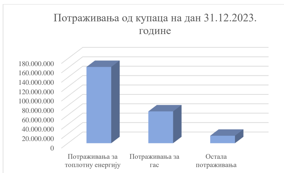
Графикон број 2: Приказ потраживања од купаца у земљи